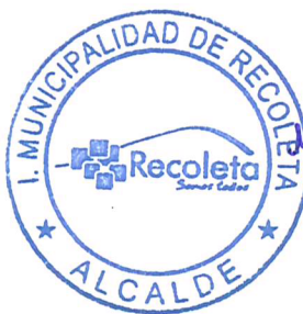
DANIEL JADUE JADUE ALCALDE